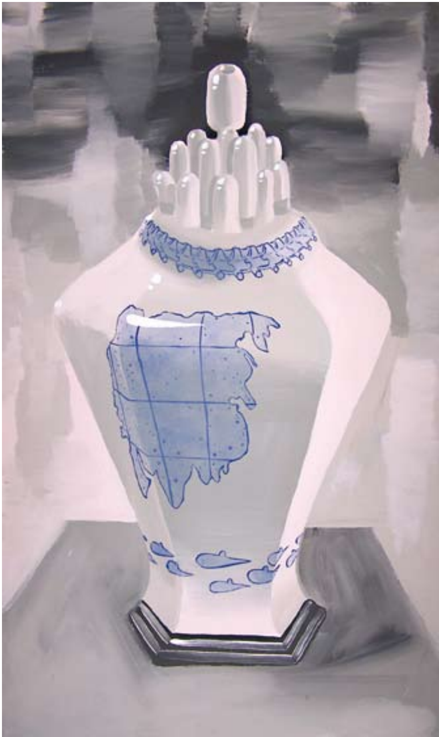
Vytříbený vkus III 150x90, akryl na plátně, 2006