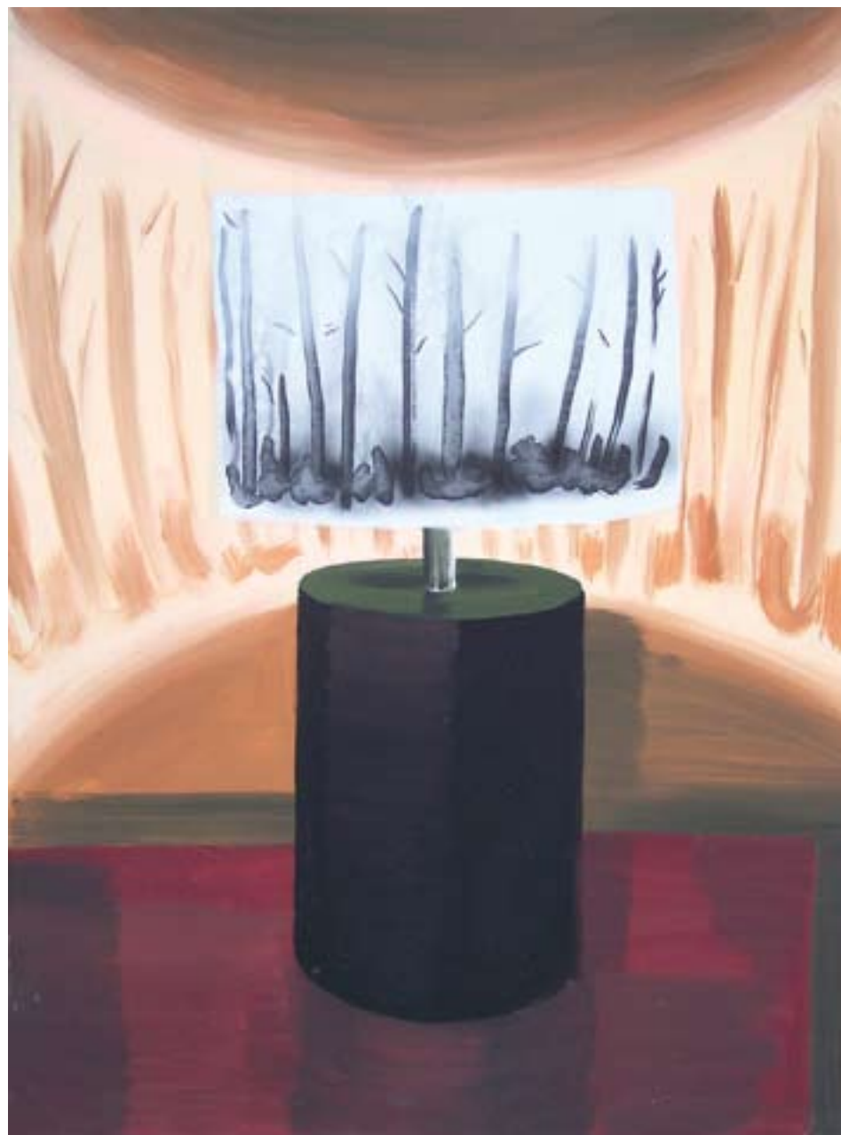
Světluška 115x85, akryl na plátně, 2009