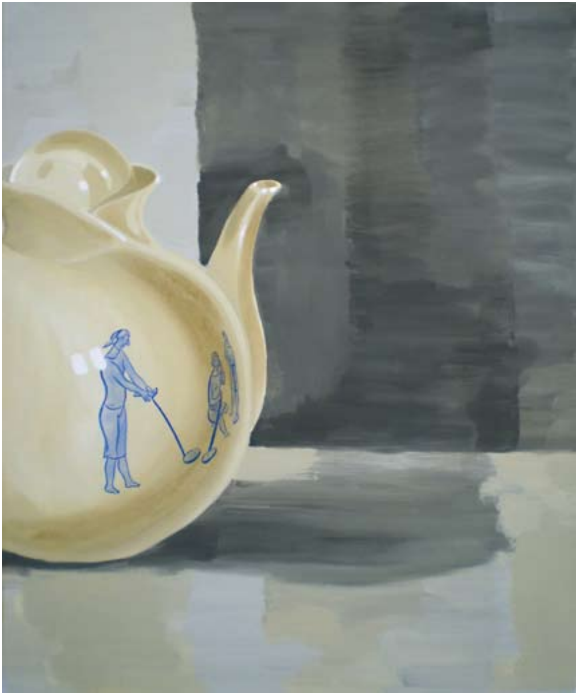
Tři grácie 120x100, akryl na plátně, 2009