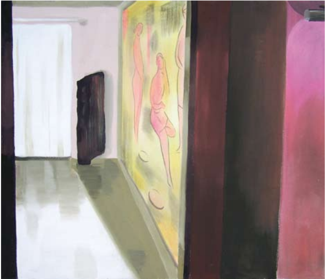
Freska 110x130, akryl na plátně, 2008