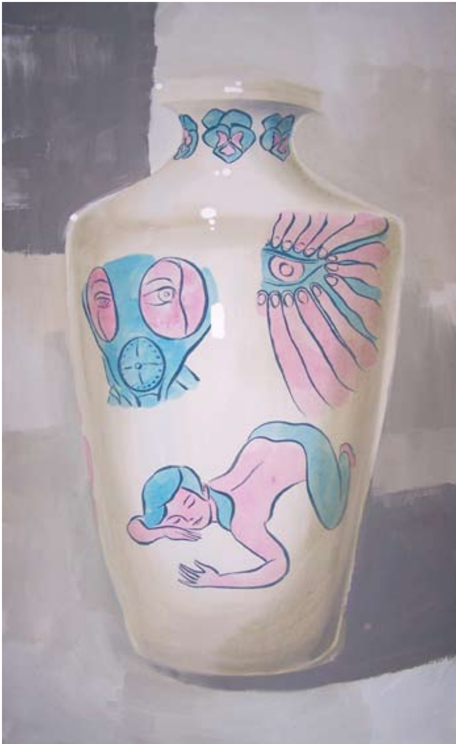
Vytříbený vkus I 150x90, akryl na plátně, 2006