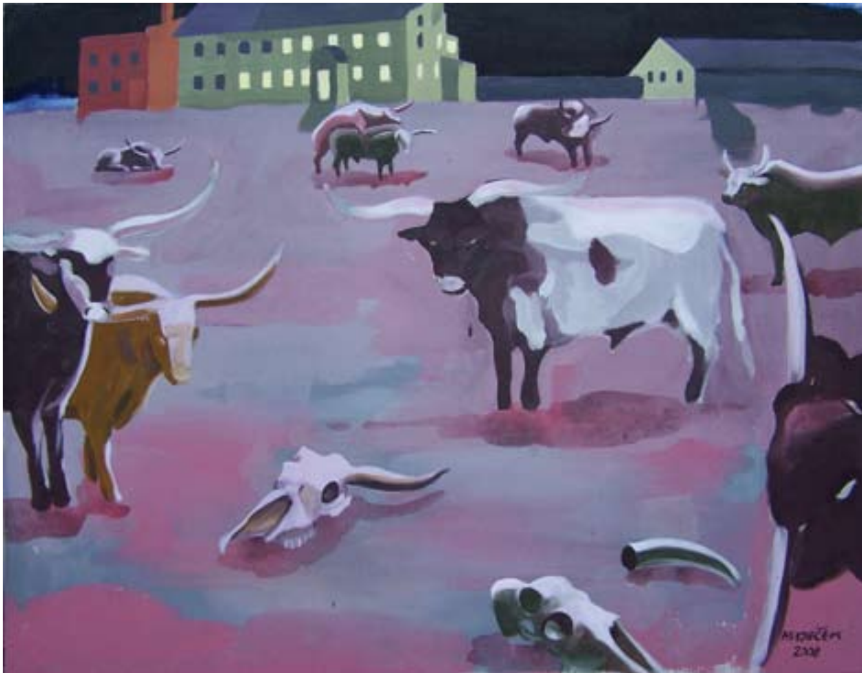
Vernisáž 110x140, akryl na plátně, 2008, soukromá sbírka