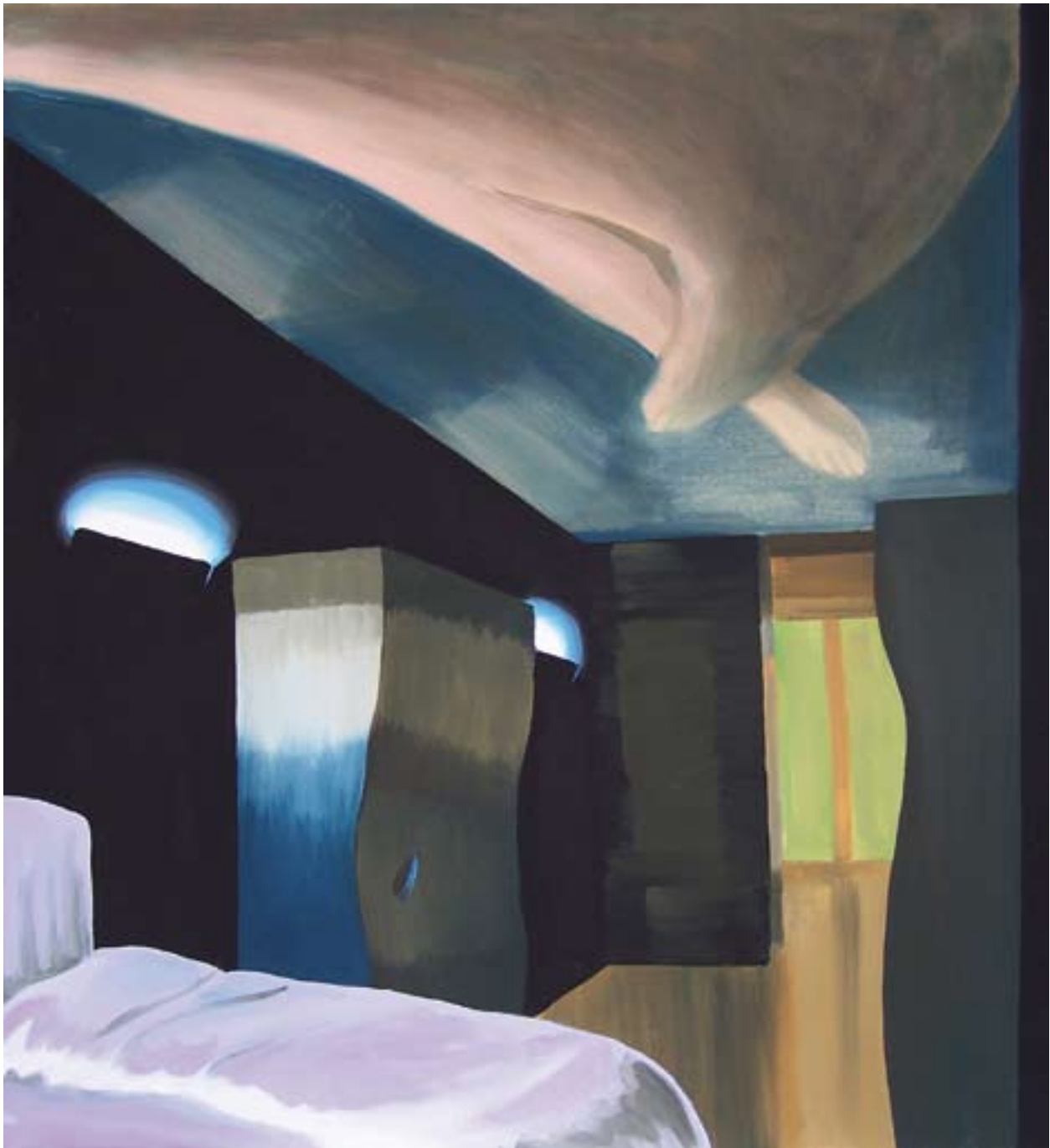
Na vlně 115x105, akryl na plátně, 2009