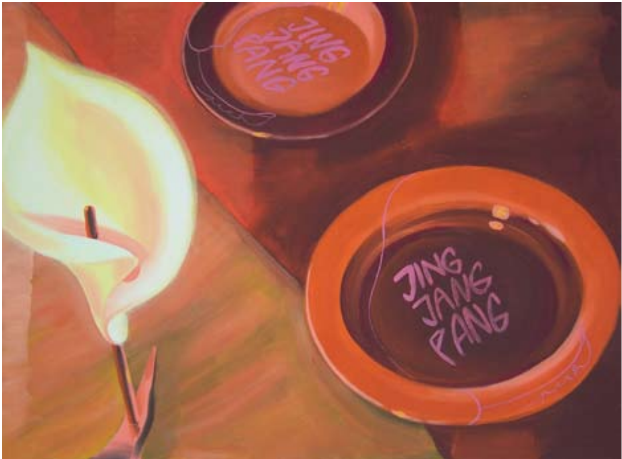
Královna pangu 115x160, akryl na plátně, 2009