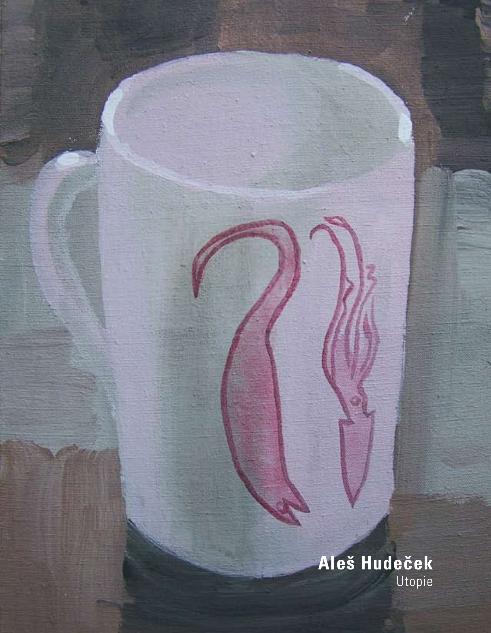
Aleš Hudeček Utopie