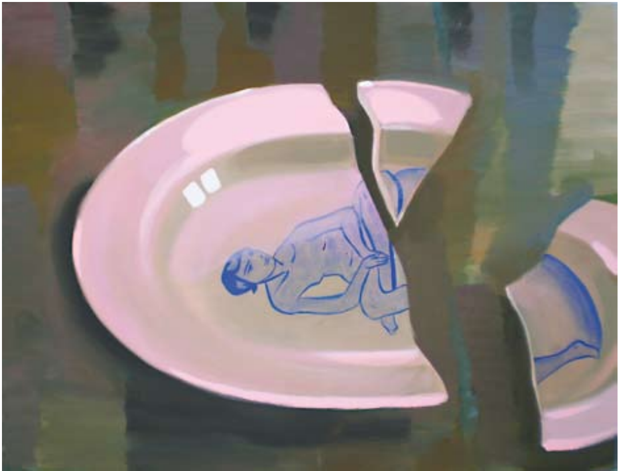
Snídaně v trávě 120x90, akryl na plátně, 2009