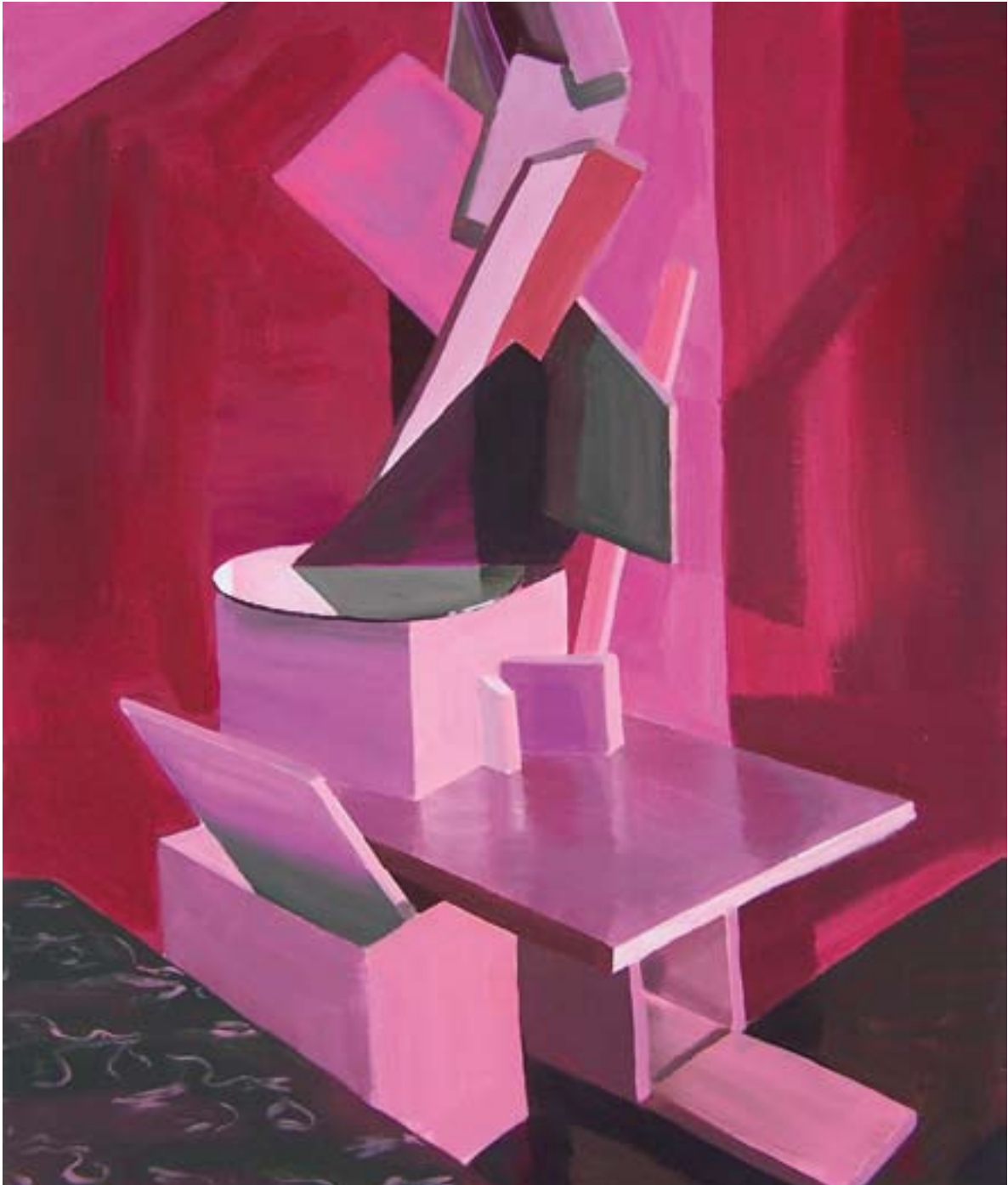
Knihovna 120x100, akryl na plátně, 2009