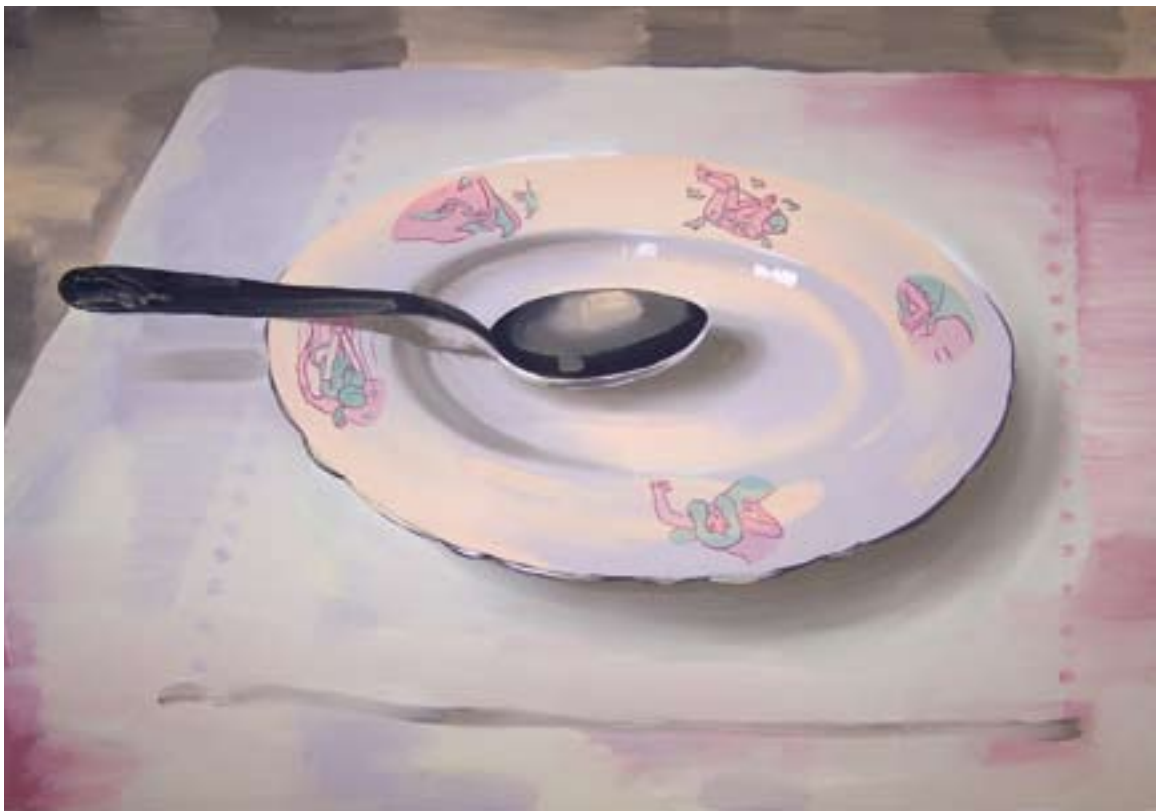
U P. Pastrňáka 65x130, akryl na plátně, 2007 Mistr a Markétka 105x150, akryl na plátně, 2007