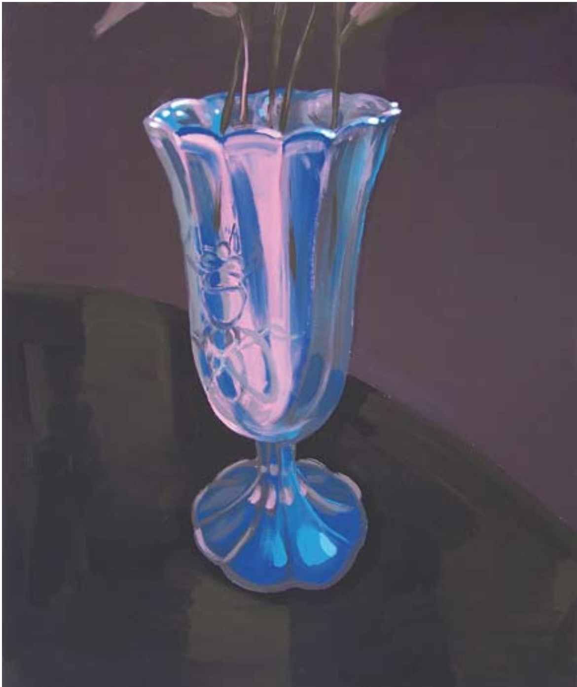
Světlo milka fialová 100x80, akryl na plátně, 2009