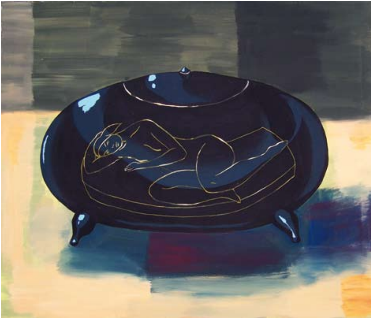
Olympia 100x120, akryl na plátně, 2009