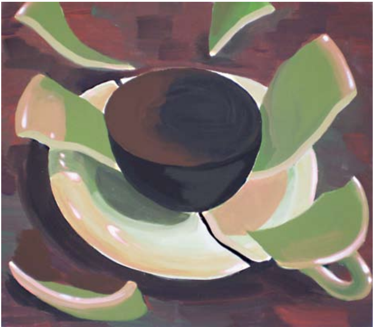
Maďarská káva 70x80, akryl na plátně, 2009