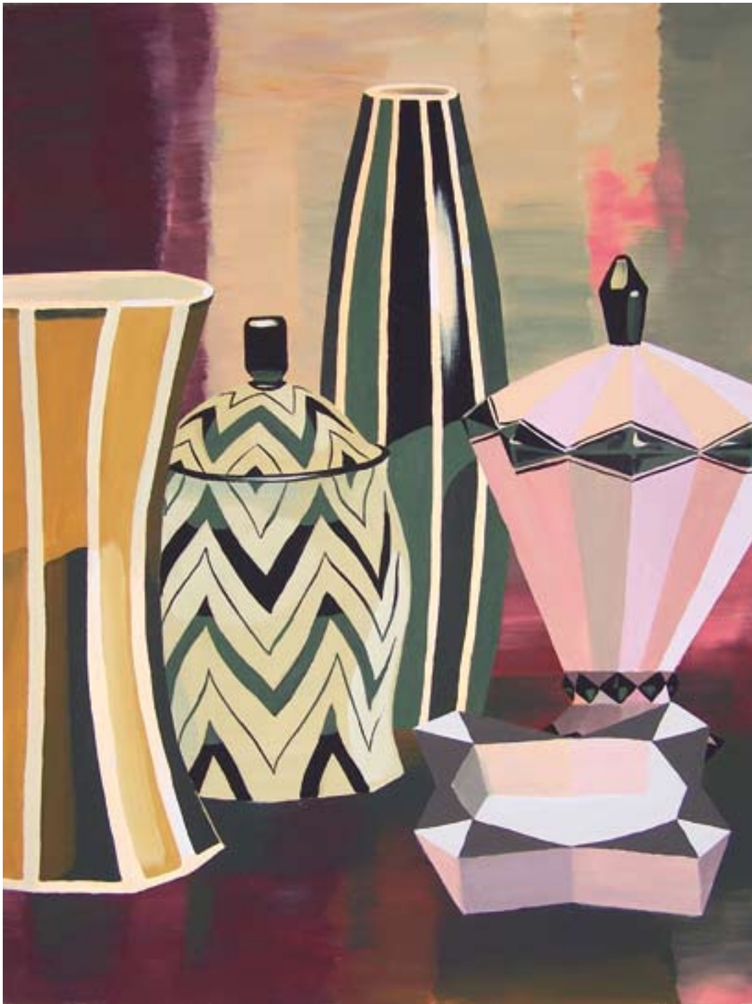
Slečny z Avignonu 120x90, akryl na plátně, 2009