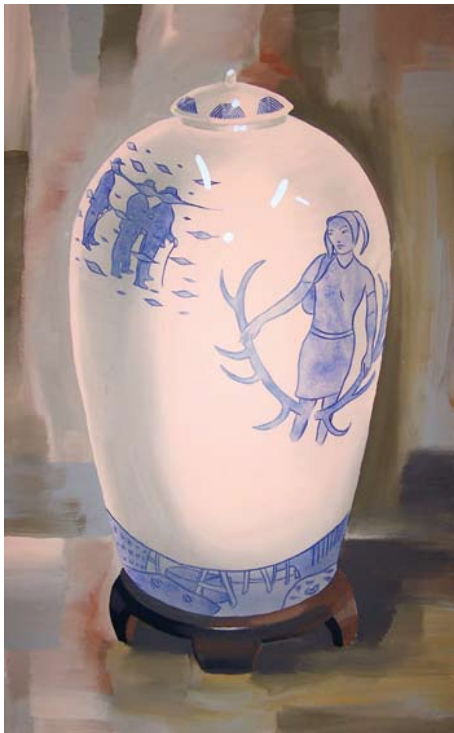
Vytříbený vkus II 150x90, akryl na plátně, 2006