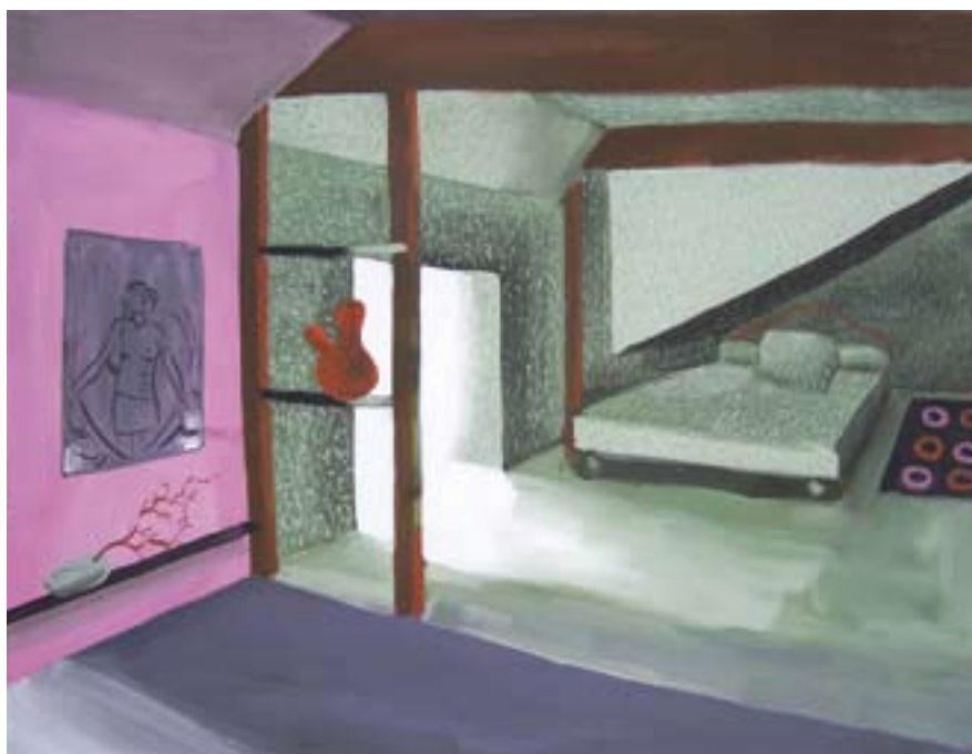
Chyba v Matrixu 115x95, akryl na plátně, 2008 Next 85x115, akryl na plátně, 2008